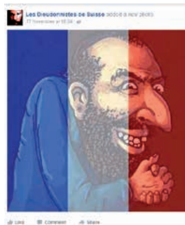
Page Facebook « Dieudonnistes de Suisse », 17.11.2015