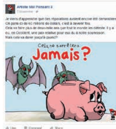
Page « Artiste Mal Pensant 3 », 7.11.2015